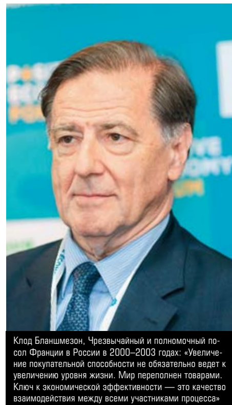
Клод Бланшмезон, Чрезвычайный и полномочный посол Франции в России в 2000–2003 годах: «Увеличение покупательной способности не обязательно ведет к увеличению уровня жизни. Мир переполнен товарами. Ключ к экономической эффективности — это качество взаимодействия между всеми участниками процесса»

На форуме обнаружили неожиданные кейсы практик, близких к социальным предпринимательству. «У нас есть фонд поддержки малого бизнеса. Около 90 миллионов рублей мы выделяем малому бизнесу в кредит под восемь процентов годовых. А эти самые восемь процентов направляем на софинансирование таких инициатив», — рассказал глава Октябрьского сельского района Ростовской области Евгений Луганцев .